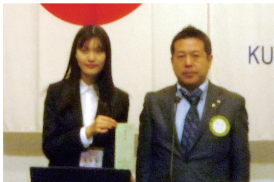
11月分米山奨学金授与