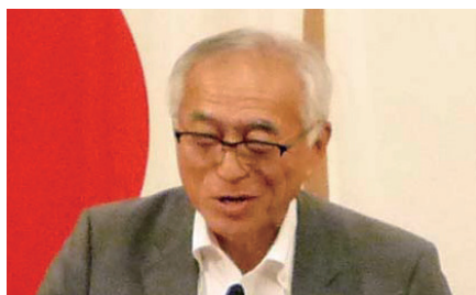
榎 主税会員増強・維持委員長